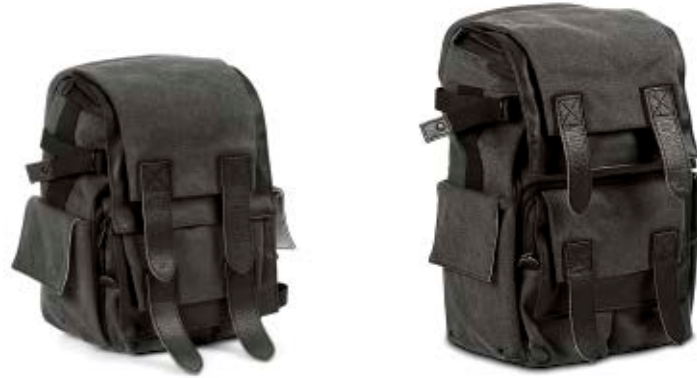
SMALL RUCKSACK NG W5051