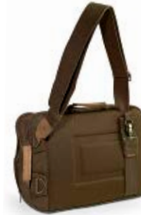
SMALL RUCKSACK NG A5250

Internal Dimensions / Dimensioni Interne / Abmessungen innen: L: 29,00 cm - 11.42" / W: 8,00 cm - 3.15" / H: 41,00 cm - 16.14" External Dimensions / Dimensioni Esterne / Abmessungen Außen: L: 31,00 cm - 12.2" / W: 12,00 cm - 4.72" / H: 42,50 cm - 16.73" Weight / Peso / Gewicht: 0,935 Kg - 2.06 lbs