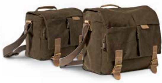
MEDIUM TOTE BAG NG A8121