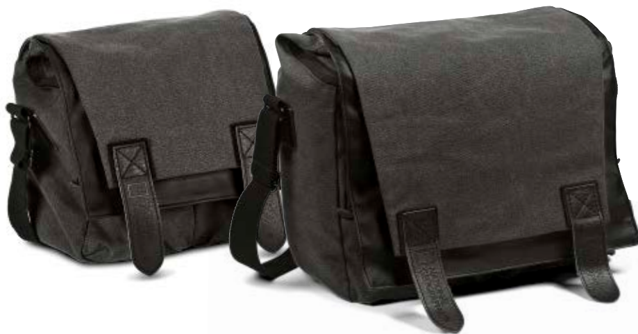
MIDI SACHEL NG W2141

Die Walkabout Umhängetaschen (NG W2141 und NG W2161) begleiten Sie bei Ihren alltäglichen Abenteuern und bieten optimalen Schutz für Ihre persönlichen Dinge, die Fotoausrüstung und Medienzubehör. Für hohen Tragekomfort verfügen die Taschen über einen Handtragegriff, einen breiten Schultergurt und eine Lasche an der Rückseite zur Befestigung an einem Trolley.