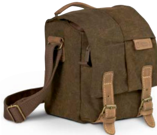
MEDIUM HOLSTER NG A2210

Internal Dimensions / Dimensioni Interne / Abmessungen innen: L: 10,00 cm - 3.94" / W: 9,50 cm - 3.74" / H: 13,50 cm - 5.31" External Dimensions / Dimensioni Esterne / Abmessungen Außen: L: 12,00 cm - 4.72" / W: 11,50 cm - 4.53" / H: 14,50 cm - 5.71" Weight / Peso / Gewicht: 0,26 Kg - 0.57 lbs