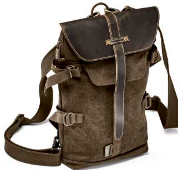
BACKPACK / SLING BAG NG A4569

Internal Dimensions / Dimensioni Interne / Abmessungen innen: L: 16,00 cm - 6.3" / W: 4,00 cm - 1.57" / H: 25,50 cm - 10.04" External Dimensions / Dimensioni Esterne / Abmessungen Außen: L: 17,00 cm - 6.69" / W: 5,00 cm - 1.97" / H: 27,00 cm - 7.8" Weight / Peso / Gewicht: 0,55 kg - 1.21 lbs