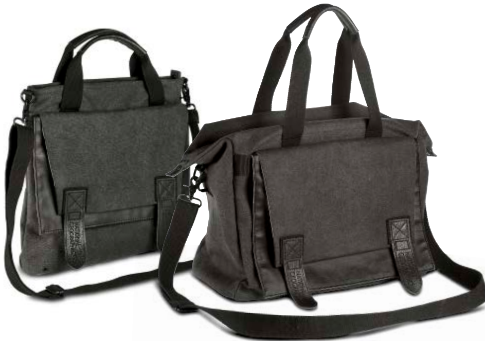
MEDIUM TOTE BAG NG W8121

Die Walkabout Tragetaschen (NG W8121 und NG W8240) eignen sich ausgezeichnet für Tagesausflüge. Sie bieten sicheren Schutz für Ihre persönlichen Dinge, die Fotoausrüstung und Medienzubehör. Ein Hauptfach mit Reißverschlussöffnung erlaubt den schnellen Zugriff auf den Inhalt. Ein spezielles Reißverschlussfach auf der oberen Klappe dient zur Unterbringung eines Smartphones oder kleiner Zubehöerteile.