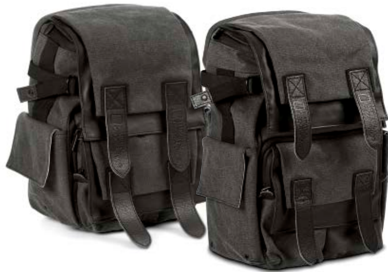
SMALL RUCKSACK NG W5051

Mit den Walkabout Rucksäcken (NG W5051 und NG W5071) können Sie unbeschwert reisen, da Sie jederzeit sicher sein können, alles Wesentliche bei sich zu tragen. Das untere, gepolsterte Fotofach bietet Platz für eine DSLR-Kamera mit angesetztem Objektiv, zusätzliche Objektive und Blitzgerät. Das obere Fach dient zur Aufbewahrung persönlicher Dinge. Die Trennwand zwischen dem oberen und unteren Fach kann entfernt werden, so dass ein großer Innenraum entsteht. Für bequemes Tragen verfügt die Tasche neben der Rucksackfunktion über einen Handtragegriff und eine Lasche an der Rückseite zur Befestigung an einem Trolley. Die gepolsterte, atmungsaktive Rückenauflage garantiert ein angenehm kühles Tragegefühl.