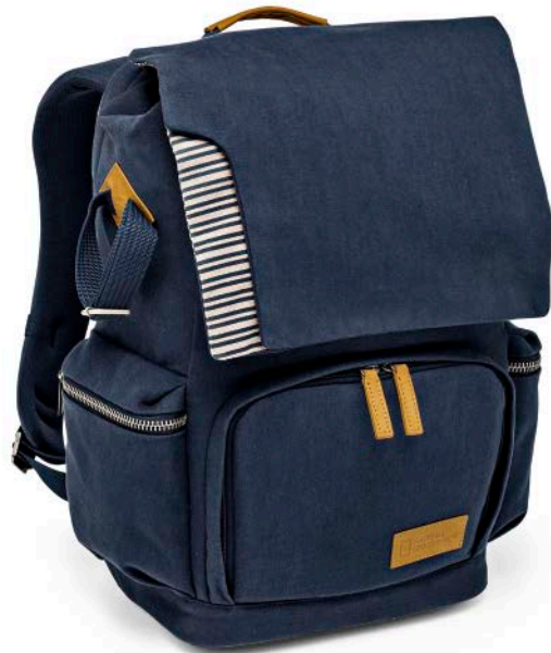
MEDIUM BACKPACK NG MC5350

Der mittelgroße Mediterranean Rucksack (NG MC 5350) bietet viel Platz für Ihre wichtigen Dinge. Der obere und der untere Bereich des Rucksacks sind durch eine entnehmbare Tasche voneinander abgetrennt. Die Fotoausrüstung wird im unteren Fach sicher verstaut und kann über die Fronttasche leicht entnommen werden. Der Rucksack bietet darüber hinaus eine einfache Lösung zur Befestigung eines Stativs und Platz für einen Laptop.