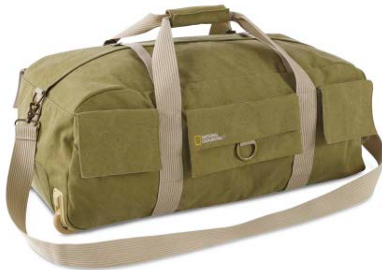
ROLLING DUFFEL BAG NG 6130

In die mit Rollen ausgestattete Earth Explorer Freizeittasche (NG 6130) passt alles, was man benötigt. Sie verfügt über eine speziell gepolsterte Tasche zum sicheren Transport Ihrer kompakten DSLR-Kamera samt Objektiv.