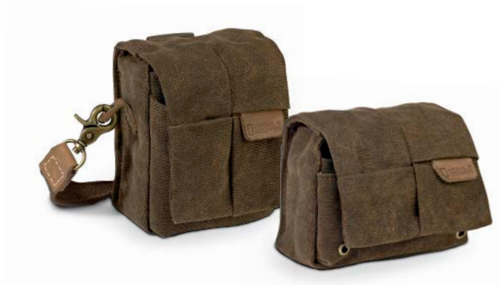
VERTICAL POUCH NG A1212

Die Africa Kameraetuis (NG A1212 und NG A1222) bieten sicheren Schutz für eine kleine Kompaktkamera und Medienzubehör.