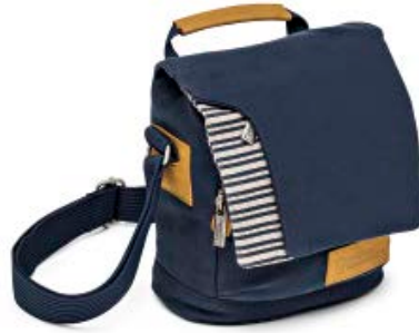
MEDIUM HOLSTER NG MC2250