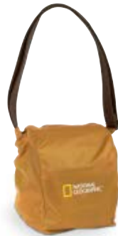
RAIN COVER NG A2210RC