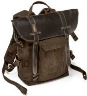
SMALL BACKPACK NG A5280