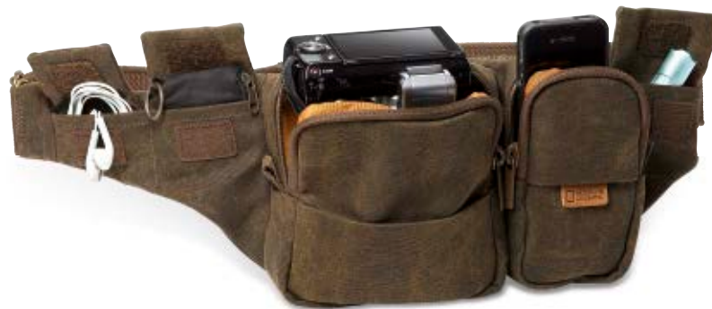
WAIST PACK NG A4470

Die Africa Hüfttasche (NG A4470) bietet Platz für eine Kompaktkamera und Alltagsgegenstände.