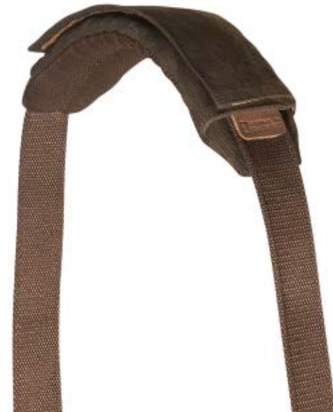
SHOULDER PAD NG A7300

Das Africa Schulterpolster (NG A7300) lässt sich leicht am Tragegurt befestigen und bietet zusätzlichen Komfort beim Tragen jeder Tasche aus einer der vier Fototaschen-Kollektionen von National Geographic.