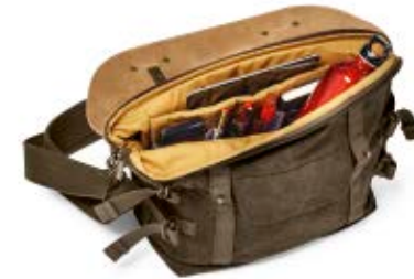
MIDI SATCHEL NG A2140

Internal Dimensions / Dimensioni Interne / Abmessungen innen: L: 28,00 cm - 11.02" / W: 12,50 cm - 4.92" / H: 25,00 cm - 9.84" External Dimensions / Dimensioni Esterne / Abmessungen Außen: L: 30,00 cm - 11.81" / W: 13,50 cm - 5.31" / H: 28,00 cm - 11.02" Weight / Peso / Gewicht: 1,05 kg - 2.31 lbs