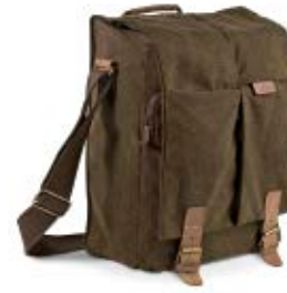
SLIM SATCHEL NG A2550