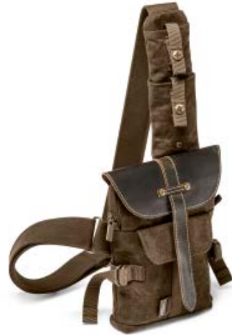
SMALL SLING BAG NG A4567