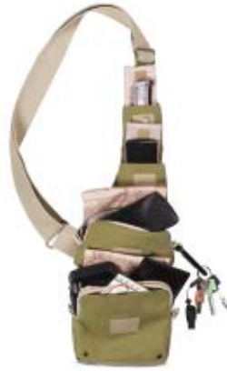
SMALL SLING BAG NG 4568