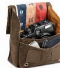
HORIZONTAL POUCH NG A1222

Internal Dimensions / Dimensioni Interne / Abmessungen innen: L: 11,50 cm - 4,53" / W: 5,00 cm - 1,97" / H: 8,00 cm - 3,15" External Dimensions / Dimensioni Esterne / Abmessungen Außen: L: 12,00 cm - 4,72" / W: 7,50 cm - 2,95" / H: 9,50 cm - 3,74" Weight / Peso / Gewicht: 0,095 Kg - 0,21 lbs