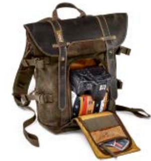
SMALL BACKPACK NG A5280

Internal Dimensions / Dimensioni Interne / Abmessungen innen: L: 22,00 cm - 8.66" / W: 11,00 cm - 4.33" / H: 20,00 cm - 7.87" External Dimensions / Dimensioni Esterne / Abmessungen Außen: L: 24,00 cm - 9.45" / W: 13,00 cm - 5.12" / H: 38,00 cm - 14.96" Weight / Peso / Gewicht: 1,18 kg - 2.60 lbs