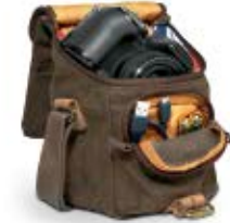
SMALL HOLSTER NG A2200

Internal Dimensions / Dimensioni Interne / Abmessungen innen: L: 10,00 cm - 3.94" / W: 9,50 cm - 3.74" / H: 13,50 cm - 5.31" External Dimensions / Dimensioni Esterne / Abmessungen Außen: L: 12,00 cm - 4.72" / W: 11,50 cm - 4.53" / H: 14,50 cm - 5.71" Weight / Peso / Gewicht: 0,26 Kg - 0.57 lbs