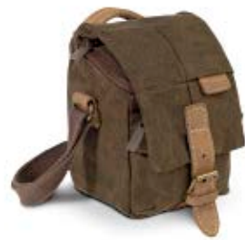
SMALL HOLSTER NG A2200