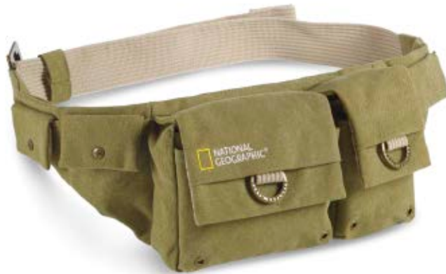
SMALL WAIST PACK NG 4476

Die kleine Earth Explorer Hüfttasche (NG 4476) bietet Platz für eine Kamera und Alltagsgegenstände. Die Tasche verfügt über spezielle Schutzzonen, in denen die empfindliche Ausrüstung sicher verstaut werden kann.