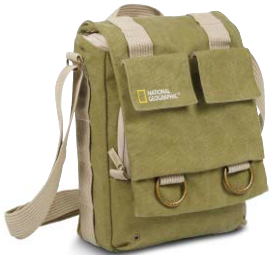
SLIM SHOULDER BAG NG 2300

Die schmale Earth Explorer Schultertasche (NG 2300) ist eine funktionale Alltagstasche im Hochformat, die Platz für Ihre persönlichen Dinge, ein Tablet und eine spiegellose Kamera bietet.