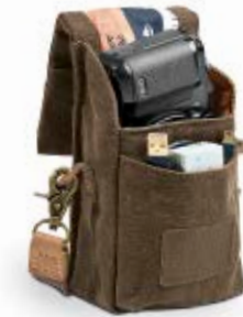
VERTICAL POUCH NG A1212

Internal Dimensions / Dimensioni Interne / Abmessungen innen: L: 9,00 cm - 3,54" / W: 5,50 cm - 2,17" / H: 12,00 cm - 4,72" External Dimensions / Dimensioni Esterne / Abmessungen Außen: L: 9,50 cm - 3,74" / W: 8,00 cm - 3,15" / H: 13,00 cm - 5,12" Weight / Peso / Gewicht: 0,195 Kg - 0,43 lbs