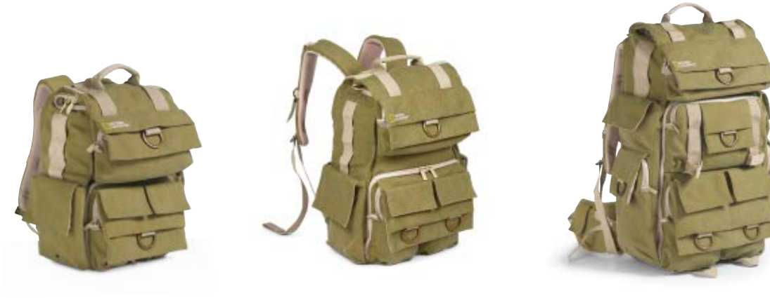
SMALL BACKPACK NG 5158