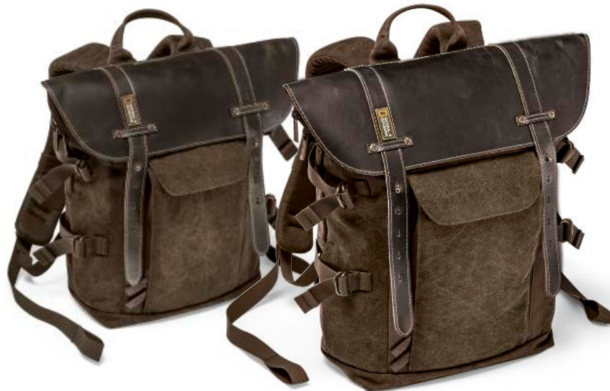
SMALL BACKPACK NG A5280

Die neuen Africa Rucksäcke (NG A5280 und NG A5290) bieten Platz für Ihre wichtigen Dinge. Der obere und der untere Bereich des Rucksacks sind durch eine entnehmbare Tasche voneinander abgetrennt. Ihre Foto- oder Videoausrüstung wird im unteren Fach sicher verstaut und kann über die Fronttasche leicht entnommen werden. Diese Rucksäcke bieten außerdem eine einfache Lösung zur Befestigung eines Stativs sowie Unterbringung eines Laptops. Sie sind mit hochwertigen Details aus echtem Leder ansprechend gestaltet.