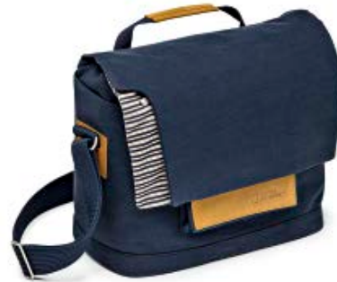
MEDIUM MESSENGER NG MC2450