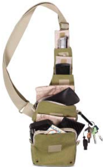
SMALL SLING BAG NG 4568

Die kleine Earth Explorer Slingtasche (NG 4568) und deren größere Schwester (NG 4475) bieten Platz für Alltagsgegenstände und eine Kompaktkamera oder eine spiegellose Systemkamera, ein Smartphone und anderes kleines Zubehör. Die Taschen verfügen über speziell geschützte Fächer, in denen die empfindliche Ausrüstung sicher verstaut werden kann.