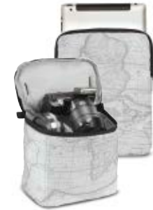
MEDIUM TOTE BAG NG W8121

Internal Dimensions / Dimensioni Interne / Abmessungen innen: L: 36,00 cm - 14.17" / W: 4,00 cm - 1.57" / H: 38,00 cm - 14.96" External Dimensions / Dimensioni Esterne / Abmessungen Außen: L: 38,00 cm - 14.96" / W: 5,00 cm - 1.97" / H: 40,00 cm - 15.75" Weight / Peso / Gewicht: 0,72 kg - 1.59 lbs