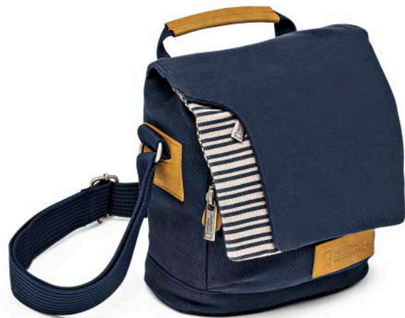
MEDIUM HOLSTER NG MC2250

Der mittelgroße Mediterranean Halfter (NG MC 2250) bietet sicheren Schutz für eine kompakte Systemkamera oder eine Einsteiger-DSLR sowie ein zusätzliches Objektiv.