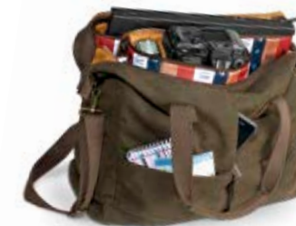
LARGE TOTE BAG NG A8240

Internal Dimensions / Dimensioni Interne / Abmessungen innen: L: 44,00 cm - 17,32" / W: 19,00 cm - 7,48" / H: 32,00 cm - 12,60" External Dimensions / Dimensioni Esterne / Abmessungen Außen: L: 45,00 cm - 17,73" / W: 20,00 cm - 7,88" / H: 33,00 cm - 13,00" Weight / Peso / Gewicht: 1,145 Kg - 2.52 lbs