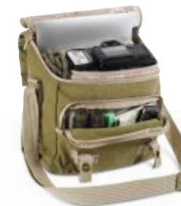
MIDI MESSENGER NG 2346

Internal Dimensions / Dimensioni Interne / Abmessungen innen: L: 26,00 cm - 10.24" / W: 12,50 cm - 4.92" / H: 21,00 cm - 8.27" External Dimensions / Dimensioni Esterne / Abmessungen Außen: L: 28,00 cm - 11.02" / W: 16,00 cm - 6.30" / H: 25,00 cm - 9.84" Weight / Peso / Gewicht: 0,80 kg - 1.76 lbs