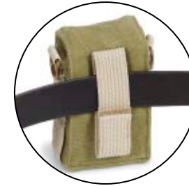
NANO CAMERA POUCH NG 1146

Internal Dimensions / Dimensioni Interne / Abmessungen innen: L: 7,50 cm - 2.95" / W: 4,00 cm - 1.57" / H: 12,00 cm - 4.72" External Dimensions / Dimensioni Esterne / Abmessungen Außen: L: 8,00 cm - 3.15" / W: 6,00 cm - 2.36" / H: 14,00 cm - 5.51" Weight / Peso / Gewicht: 0,17 Kg - 0.37 lbs