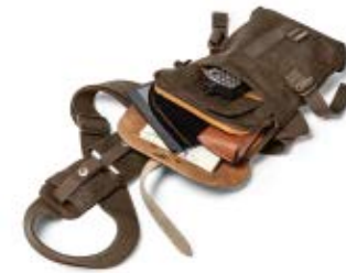
SMALL SLING BAG NG A4567

Internal Dimensions / Dimensioni Interne / Abmessungen innen: L: 16,00 cm - 6.3" / W: 4,00 cm - 1.57" / H: 25,50 cm - 10.04" External Dimensions / Dimensioni Esterne / Abmessungen Außen: L: 17,00 cm - 6.69" / W: 5,00 cm - 1.97" / H: 27,00 cm - 7.8" Weight / Peso / Gewicht: 0,55 kg - 1.21 lbs