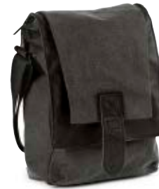
SLIM SHOULDER BAG NG W2300