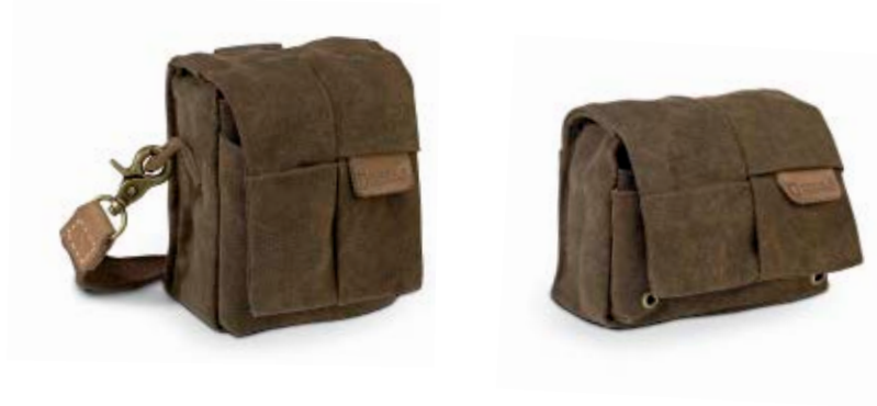
VERTICAL POUCH NG A1212