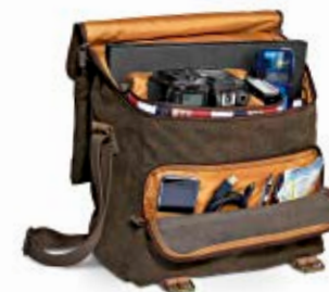
MEDIUM SACHEL NG A2560

Internal Dimensions / Dimensioni Interne / Abmessungen innen: L: 34,00 cm - 13.39" / W: 14,00 cm - 5.51" / H: 29,00 cm - 11.42" External Dimensions / Dimensioni Esterne / Abmessungen Außen: L: 36,00 cm - 14.17" / W: 18,00 cm - 7.09" / H: 30,00 cm - 11.81" Weight / Peso / Gewicht: 1,07 Kg - 2.36 lbs