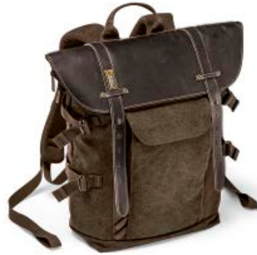
MEDIUM BACKPACK NG A5290