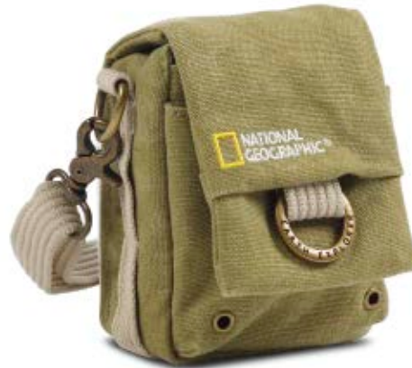
MEDIUM POUCH NG 1153

Internal Dimensions / Dimensioni Interne / Abmessungen innen: L: 7,50 cm - 2.95" / W: 4,00 cm - 1.57" / H: 12,00 cm - 4.72" External Dimensions / Dimensioni Esterne / Abmessungen Außen: L: 8,00 cm - 3.15" / W: 6,00 cm - 2.36" / H: 14,00 cm - 5.51" Weight / Peso / Gewicht: 0,17 Kg - 0.37 lbs