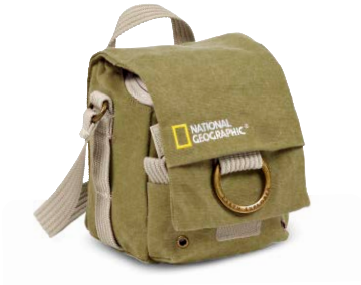
SMALL HOLSTER NG 2342

Der kleine Earth Explorer Halfter (NG 2342) bietet sicheren Schutz für eine spiegellose Kamera und ein zusätzliches Objektiv, eine kompakte Systemkamera oder eine kleine DSLR-Kamera sowie Medienzubehör.