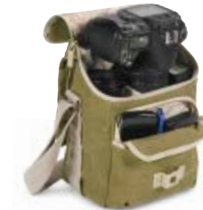
SMALL SHOULDER BAG NG 2344

Internal Dimensions / Dimensioni Interne / Abmessungen innen: L: 15,00 cm - 5.91" / W: 12,00 cm - 4.72" / H: 18,00 cm - 7.09" External Dimensions / Dimensioni Esterne / Abmessungen Außen: L: 17,00 cm - 6.69" / W: 15,00 cm - 5.91" / H: 21,00 cm - 8.27" Weight / Peso / Gewicht: 0,45 Kg - 0.99 lbs