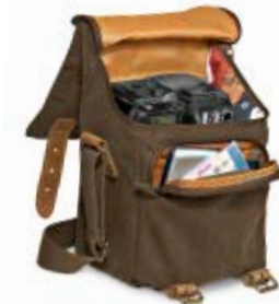
MEDIUM HOLSTER NG A2210

Internal Dimensions / Dimensioni Interne / Abmessungen innen: L: 16,00 cm - 6.3" / W: 11,00 cm - 4.33" / H: 19,00 cm - 7.48" External Dimensions / Dimensioni Esterne / Abmessungen Außen: L: 17,00 cm - 6.69" / W: 13,00 cm - 5.12" / H: 20,00 cm - 7.87" Weight / Peso / Gewicht: 0,47 Kg - 1.04 lbs