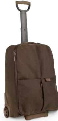
ONBOARD ROLLER NG A6010