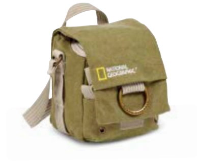
SMALL HOLSTER NG 2342