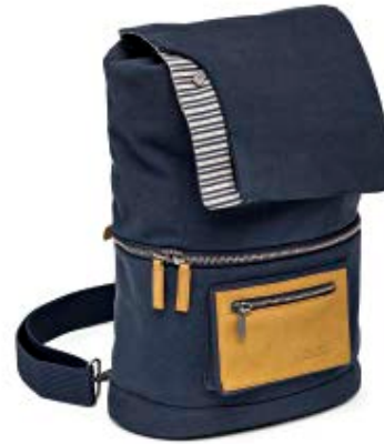
MEDIUM SLING NG MC4550