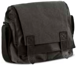
SLENDER MESSENGER BAG NG W2400