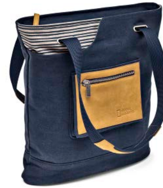
MEDIUM TOTE NG MC2550