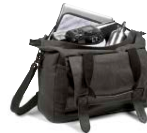
LARGE TOTE BAG NG W8240

Internal Dimensions / Dimensioni Interne / Abmessungen innen: L: 44,00 cm - 17.32" / W: 19,00 cm - 7.48" / H: 32,00 cm - 12.60" External Dimensions / Dimensioni Esterne / Abmessungen Außen: L: 45,00 cm - 17.72" / W: 20,00 cm - 7.87" / H: 33,00 cm - 12.99" Weight / Peso / Gewicht: 1,15 kg - 2.54 lbs