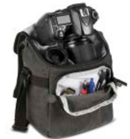
MEDIUM HOLSTER NG W2026

Internal Dimensions / Dimensioni Interne / Abmessungen innen: L: 16,00 cm - 6.30" / W: 11,50 cm - 4.53" / H: 17,50 cm - 6.89" External Dimensions / Dimensioni Esterne / Abmessungen Außen: L: 19,00 cm - 7.48" / W: 15,00 cm - 5.91" / H: 23,00 cm - 9.06" Weight / Peso / Gewicht: 0,40 kg - 0.88 lbs