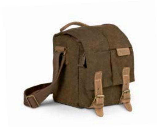
MEDIUM HOLSTER NG A2210