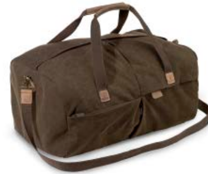
MEDIUM DUFFLE BAG NG A6120