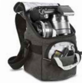
SMALL HOLSTER NG W2022

Internal Dimensions / Dimensioni Interne / Abmessungen innen: L: 10,00 cm - 3.94" / W: 9,50 cm - 3.74" / H: 12,00 cm - 4.72" External Dimensions / Dimensioni Esterne / Abmessungen Außen: L: 12,00 cm - 4.72" / W: 11,00 cm - 4.33" / H: 17,00 cm - 6.69" Weight / Peso / Gewicht: 0,275 kg - 0.61 lbs