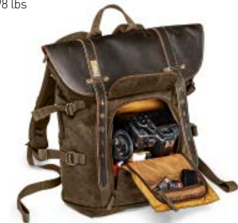
MEDIUM BACKPACK NG A5290

Internal Dimensions / Dimensioni Interne / Abmessungen innen: L: 24,50 cm - 9.65" / W: 12,00 cm - 4.72" / H: 23,00 cm - 9.06" External Dimensions / Dimensioni Esterne / Abmessungen Außen: L: 27,50 cm - 10.83" / W: 14,00 cm - 5.51" / H: 43,00 cm - 16.93" Weight / Peso / Gewicht: 1,35 kg - 2.98 lbs