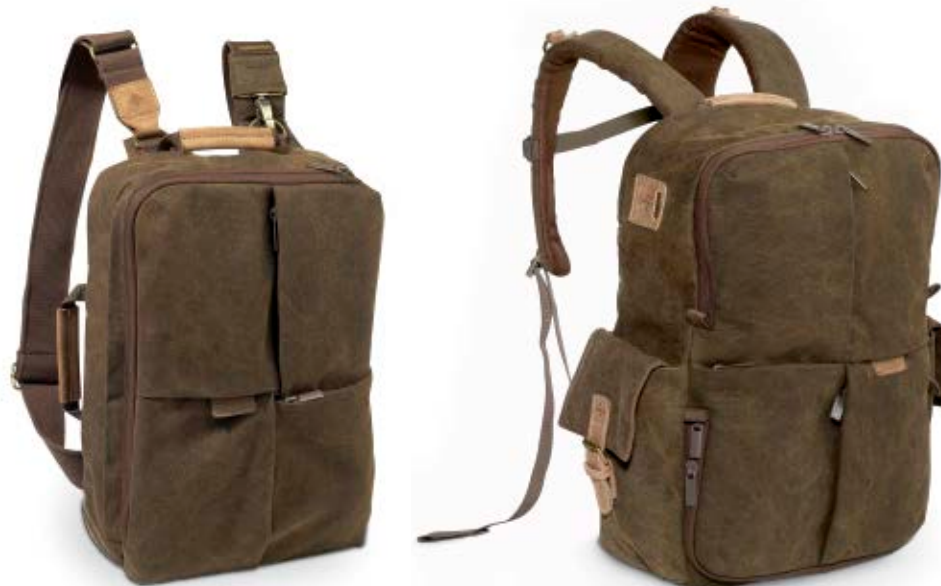
SMALL RUCKSACK NG A5250

Die Africa Rucksäcke (NG A5250 und NG A5270) bieten sicheren Schutz für Ihre Foto- oder Videoausrüstung sowie einen Laptop und reichlich Platz für persönliche Dinge.