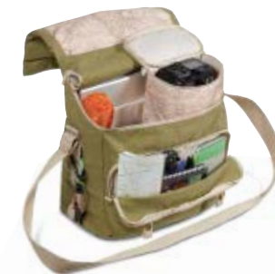
LARGE SHOULDER BAG NG 2478

Internal Dimensions / Dimensioni Interne / Abmessungen innen: L: 41,00 cm - 16.14" / W: 15,00 cm - 5.91" / H: 31,00 cm - 12.2" External Dimensions / Dimensioni Esterne / Abmessungen Außen: L: 42,50 cm - 16.73" / W: 18,00 cm - 7.09" / H: 31,00 cm - 12.2" Weight / Peso / Gewicht: 1,33 kg - 2.93 lbs