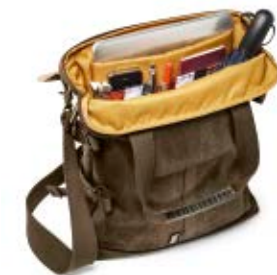
MEDIUM TOTE BAG NG A8121

Internal Dimensions / Dimensioni Interne / Abmessungen innen: L: 26,00 cm - 10.24" / W: 5,50 cm - 2.17" / H: 37,00 cm - 14.57" External Dimensions / Dimensioni Esterne / Abmessungen Außen: L: 31,00 cm - 12.20" / W: 6,50 cm - 2.56" / H: 41,00 cm - 16.14" Weight / Peso / Gewicht: 1,05 kg - 2.31 lbs