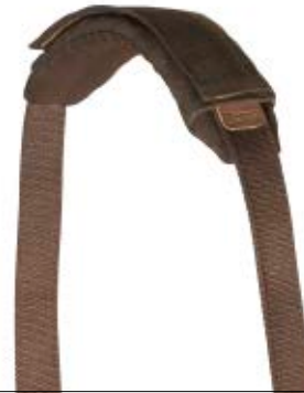
SHOULDER PAD NG A7300