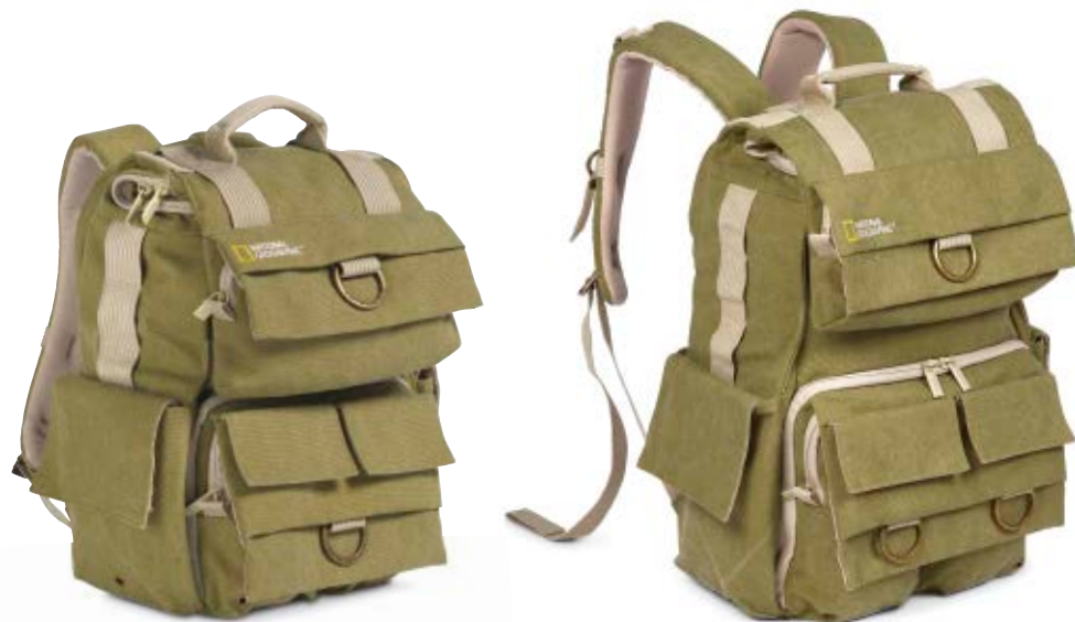
SMALL BACKPACK NG 5158

Die Earth Explorer Rucksäcke (NG 5158 und NG 5160) bieten sicheren Schutz für wichtige Gegenstände, Ihre Foto- oder Videoausrüstung und einen Laptop. Viel Platz für persönliche Dinge ist ebenfalls vorhanden. Die gepolsterte, atmungsaktive Rückenauflage garantiert ein angenehm kühles Tragegefühl.