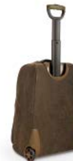
ONBOARD ROLLER NG A6010

Internal Dimensions / Dimensioni Interne / Abmessungen innen: L: 35,00 cm - 13.78" / W: 22,00 cm - 8.66" / H: 51,00 cm - 20.08" External Dimensions / Dimensioni Esterne / Abmessungen Außen: L: 38,50 cm - 15.16" / W: 27,00 cm - 10.63" / H: 57,00 cm - 22.44" Weight / Peso / Gewicht: 3,70 Kg - 8.16 lbs