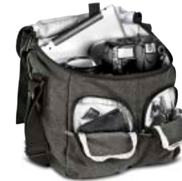
MIDI SACHEL NG W2141

Internal Dimensions / Dimensioni Interne / Abmessungen innen: L: 26,50 cm - 10.43" / W: 12,00 cm - 4.72" / H: 21,00 cm - 8.27" External Dimensions / Dimensioni Esterne / Abmessungen Außen: L: 27,00 cm - 10.63" / W: 18,00 cm - 7.09" / H: 24,00 cm - 9.45" Weight / Peso / Gewicht: 0,89 kg - 1.96 lbs