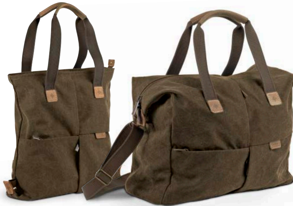
MEDIUM TOTE BAG NG A8220

Mit den Africa Tragetaschen (NG A8220 und NG A8240) sind Sie bei Tagesausflügen immer stylish unterwegs. Die Taschen bieten optimalen Schutz für eine kleine DSLR-Kamera und ein kleineres Objektiv.