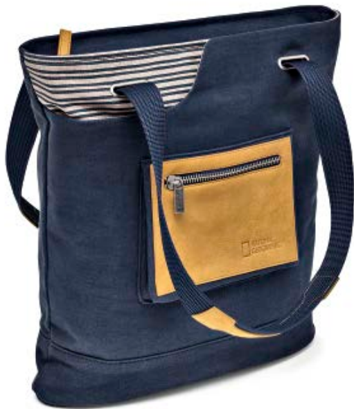
MEDIUM TOTE NG MC2550

Die mittelgroße Mediterranean Tragetasche (NG MC 2550) eignet sich ausgezeichnet für Tagesausflüge. Sie bietet sicheren Schutz und flexiblen Raum für Ihre persönlichen Dinge, die Fotoausrüstung und Medienzubehör. Ein Hauptfach mit Reißverschluss schließt den Inhalt der Tasche sicher ein. Die Tasche bietet Platz für eine Einsteiger-DSLR-Kamera mit angesetztem Objektiv oder eine kompakte Systemkamera und ein zusätzliches Objektiv.