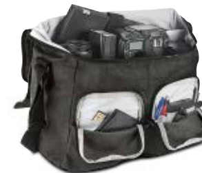
MEDIUM SACHEL NG W2161

Internal Dimensions / Dimensioni Interne / Abmessungen innen: L: 35,00 cm - 13.78" / W: 15,00 cm - 5.91" / H: 27,50 cm - 10.83" External Dimensions / Dimensioni Esterne / Abmessungen Außen: L: 36,00 cm - 14.17" / W: 19,00 cm - 7.48" / H: 29,00 cm - 11.42" Weight / Peso / Gewicht: 1,20 kg - 2.65 lbs