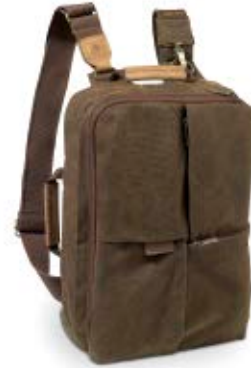
SMALL RUCKSACK NG A5250