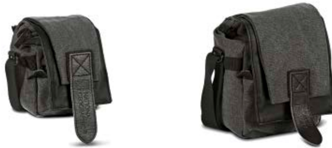
SMALL HOLSTER NG W2022