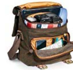
MIDI SACHEL NG A2540

Internal Dimensions / Dimensioni Interne / Abmessungen innen: L: 27,00 cm - 10.63" / W: 11,50 cm - 4.53" / H: 23,00 cm - 9.06" External Dimensions / Dimensioni Esterne / Abmessungen Außen: L: 28,00 cm - 11.02" / W: 15,00 cm - 5.91" / H: 24,00 cm - 9.45" Weight / Peso / Gewicht: 0,79 Kg - 1.74 lbs