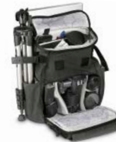
SMALL RUCKSACK NG W5051

Internal Dimensions / Dimensioni Interne / Abmessungen innen: L: 24,00 cm - 9.45" / W: 11,50 cm - 4.53" / H: 20,00 cm - 7.87" External Dimensions / Dimensioni Esterne / Abmessungen Außen: L: 28,00 cm - 11.02" / W: 20,00 cm - 7.87" / H: 37,50 cm - 14.76" Weight / Peso / Gewicht: 1,30 kg - 2.87 lbs