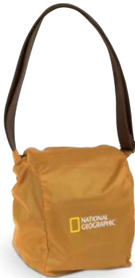
RAIN COVER NG A2210RC

Der Regenschutz (NG A2210RC) eignet sich für die kleinen oder mittleren Halfter aller National Geographic Taschenkollektionen.