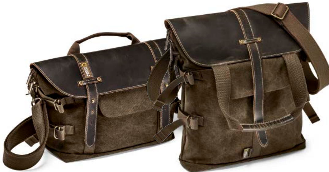
MIDI SATCHEL NG A2140

Die neuen Africa schultertaschen (NG A2140 und NG A8121) sind stylische taschen für tagesausflüge. Zwei Modelle sind erhältlich, die sich für unterschiedliche Anforderungen und Verwendungszwecke eignen. Diese sind mit hochwertigen Details aus echtem Leder ansprechend gestaltet.