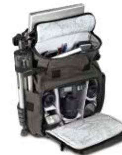
MEDIUM RUCKSACK NG W5071

Internal Dimensions / Dimensioni Interne / Abmessungen innen: L: 28,00 cm - 11.02" / W: 11,00 cm - 4.33" / H: 24,50 cm - 9.65" External Dimensions / Dimensioni Esterne / Abmessungen Außen: L: 30,00 cm - 11.81" / W: 19,00 cm - 7.48" / H: 44,00 cm - 17.32" Weight / Peso / Gewicht: 1,50 kg - 3.31 lbs