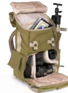
SMALL BACKPACK NG 5158

Internal Dimensions / Dimensioni Interne / Abmessungen innen: L: 24,00 cm - 9.45" / W: 11,50 cm - 4.53" / H: 19,00 cm - 7.48" External Dimensions / Dimensioni Esterne / Abmessungen Außen: L: 30,00 cm - 11.81" / W: 20,00 cm - 7.87" / H: 38,00 cm - 14.96" Weight / Peso / Gewicht: 1,36 kg - 3.00 lbs