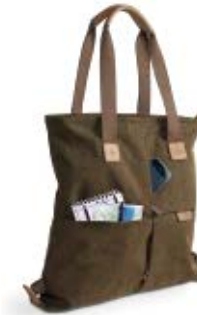
MEDIUM TOTE BAG NG A8220

Internal Dimensions / Dimensioni Interne / Abmessungen innen: L: 34,50 cm - 13,58" / W: 8,50 cm - 3,35" / H: 41,00 cm - 16,14" External Dimensions / Dimensioni Esterne / Abmessungen Außen: L: 35,00 cm - 13,78" / W: 9,00 cm - 3,55" / H: 42,00 cm - 16,54" Weight / Peso / Gewicht: 0,68 Kg - 1.50 lbs