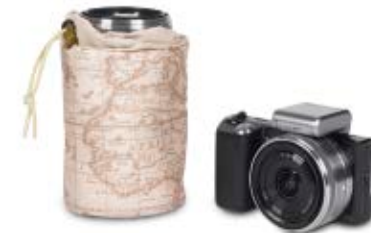
SLING BAG NG 4475

Internal Dimensions / Dimensioni Interne / Abmessungen innen: L: 17,00 cm - 6.69" / W: 5,50 cm - 2.17" / H: 15,00 cm - 5.91" External Dimensions / Dimensioni Esterne / Abmessungen Außen: L: 20,00 cm - 7.87" / W: 8,00 cm - 3.15" / H: 42,00 cm - 16.54" Weight / Peso / Gewicht: 0,56 kg - 1.23 lbs