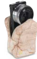
SMALL SLING BAG NG 4568

Internal Dimensions / Dimensioni Interne / Abmessungen innen: L: 15,00 cm - 5.91" / W: 5,00 cm - 1.97" / H: 15,00 cm - 5.91" External Dimensions / Dimensioni Esterne / Abmessungen Außen: L: 16,00 cm - 6.30" / W: 7,00 cm - 2.76" / H: 46,00 cm - 18.11" Weight / Peso / Gewicht: 0,44 Kg - 0.97 lbs