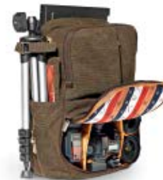
MEDIUM RUCKSACK NG A5270

Internal Dimensions / Dimensioni Interne / Abmessungen innen: L: 29,00 cm - 11.42" / W: 12,00 cm - 4.72" / H: 25,00 cm - 9.84" External Dimensions / Dimensioni Esterne / Abmessungen Außen: L: 31,00 cm - 12.20" / W: 18,00 cm - 7.09" / H: 44,00 cm - 17.32" Weight / Peso / Gewicht: 1,175 Kg - 2.59 lbs