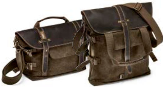
MIDI SATCHEL NG A2140