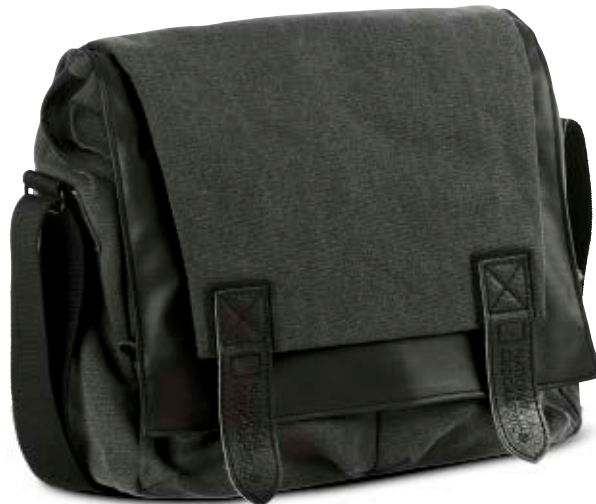
SLENDER MESSENGER BAG NG W2400

Die schlanke Walkabout Messenger-Tasche (NG W2400) begleitet Sie bei Ihren alltäglichen Abenteuern und bietet zuverlässigen Schutz für Ihre spiegellose Systemkamera mit angesetztem Objektiv, Medienzubehör und einen Laptop bis 15,4 Zoll. Eine Reißverschlussklappe schützt Ihre Ausrüstung vor äußeren Witterungseinflüssen. Die vorderen Reißverschlussaschen bieten Platz für Medienzubehör und persönliche Dinge.