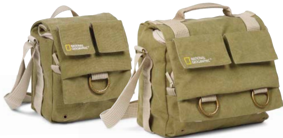
SMALL SHOULDER BAG NG 2344

Die kleine Earth Explorer Schultertasche und die mittlere Messenger-Tasche (NG 2344 und NG 2346) bieten zuverlässigen Schutz für eine kompakte Systemkamera, eine spiegellose Kamera oder eine kleine DSLR-Kamera mit zusätzlichem Objektiv sowie Medienzubehör.