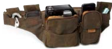
WAIST PACK NG A4470