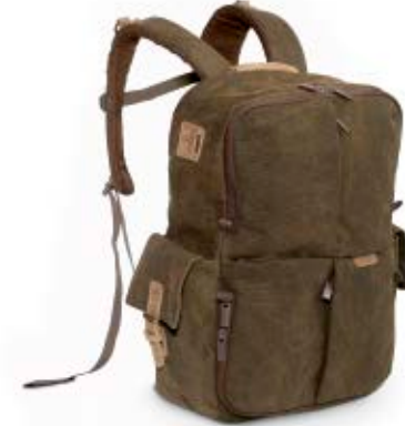
MEDIUM RUCKSACK NG A5270