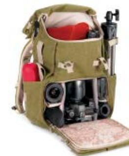
MEDIUM BACKPACK NG 5160

Internal Dimensions / Dimensioni Interne / Abmessungen innen: L: 28,00 cm - 11.02" / W: 11,00 cm - 4.33" / H: 23,00 cm - 9.06" External Dimensions / Dimensioni Esterne / Abmessungen Außen: L: 34,00 cm - 13.39" / W: 21,00 cm - 8.27" / H: 45,00 cm - 17.72" Weight / Peso / Gewicht: 1,53 kg - 3.37 lbs