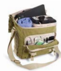
MEDIUM MESSENGER NG 2476

Internal Dimensions / Dimensioni Interne / Abmessungen innen: L: 32,00 cm - 12.6" / W: 16,00 cm - 6.3" / H: 28,00 cm - 11.02" External Dimensions / Dimensioni Esterne / Abmessungen Außen: L: 33,00 cm - 12.99" / W: 18,00 cm - 7.09" / H: 30,00 cm - 11.81" Weight / Peso / Gewicht: 1,10 kg - 2.43 lbs