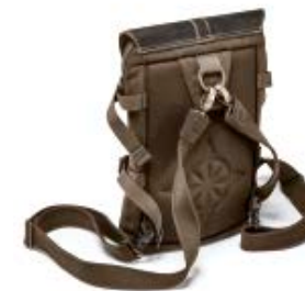
BACKPACK / SLING BAG NG A4569

Internal Dimensions / Dimensioni Interne / Abmessungen innen: L: 20,50 cm - 8.07" / W: 7,00 cm - 2.76" / H: 35,50 cm - 13.98" External Dimensions / Dimensioni Esterne / Abmessungen Außen: L: 21,50 cm - 8.46" / W: 8,00 cm - 3.15" / H: 39,00 cm - 15.35" Weight / Peso / Gewicht: 0,80 kg - 1.76 lbs