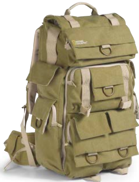
LARGE BACKPACK NG 5738

Der große Earth Explorer Rucksack (NG 5738) ist die optimale Lösung für Wanderer und professionelle Abenteurer, die eine besonders sichere Tragelösung für ihre Foto- oder Videoausrüstung sowie ihre persönlichen Dinge benötigen. Die gepolsterte, atmungsaktive Rückenauflage garantiert ein angenehm kühles Tragegefühl.