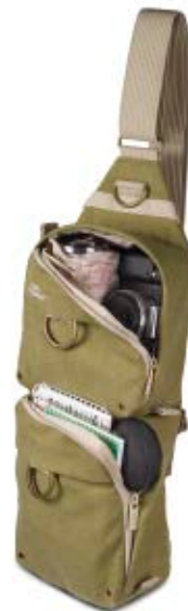
SLING BAG NG 4475

Internal Dimensions / Dimensioni Interne / Abmessungen innen: L: 15,00 cm - 5.91" / W: 5,00 cm - 1.97" / H: 15,00 cm - 5.91" External Dimensions / Dimensioni Esterne / Abmessungen Außen: L: 16,00 cm - 6.30" / W: 7,00 cm - 2.76" / H: 46,00 cm - 18.11" Weight / Peso / Gewicht: 0,44 Kg - 0.97 lbs