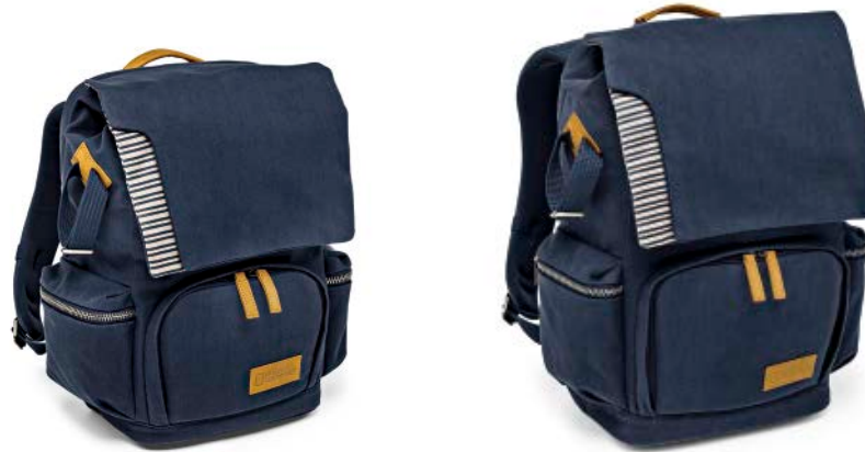
SMALL BACKPACK NG MC5320