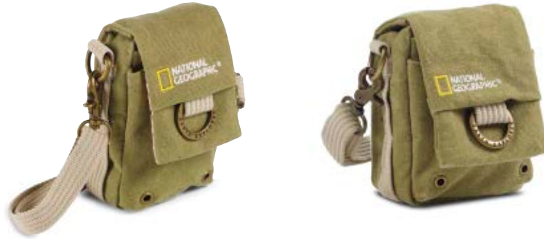
NANO CAMERA POUCH NG 1146