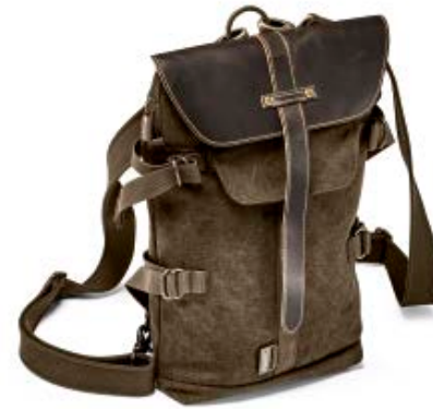
BACKPACK / SLING BAG NG A4569