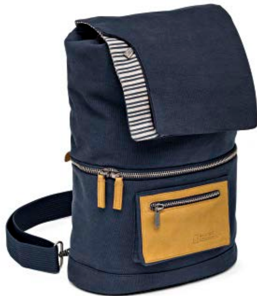
MEDIUM SLING NG MC4550

Die mittelgroße Mediterranean Slingtasche (NG MC 4550) bietet Platz für Alltagsgegenstände, eine DSLR-Kamera, ein Smartphone sowie andere kleine Zubehörteile. Die Tasche verfügt über eine spezielle Schutzzone, in der die empfindliche Ausrüstung sicher verstaut werden kann.