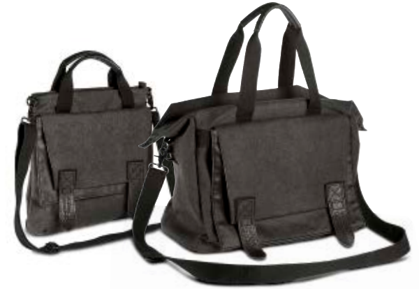
MEDIUM TOTE BAG NG W8121