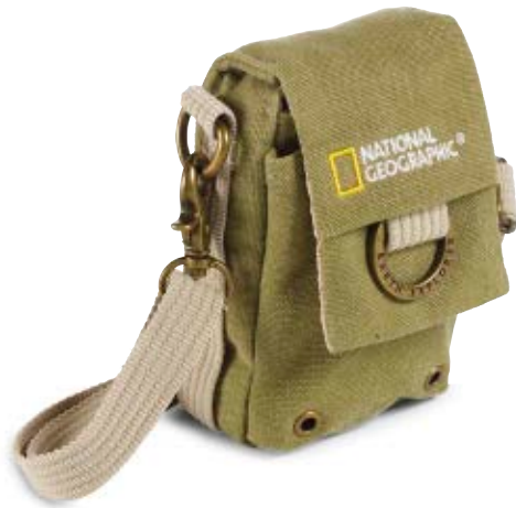
NANO CAMERA POUCH NG 1146

Die Earth Explorer Kameraetuis (NG 1146 und NG 1153) bieten sicheren Schutz für eine spiegellose Kamera, eine Kompaktkamera oder ein Smartphone.