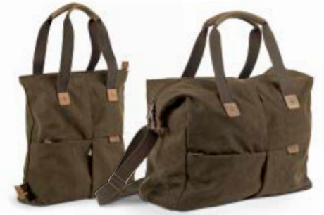
MEDIUM TOTE BAG NG A8220