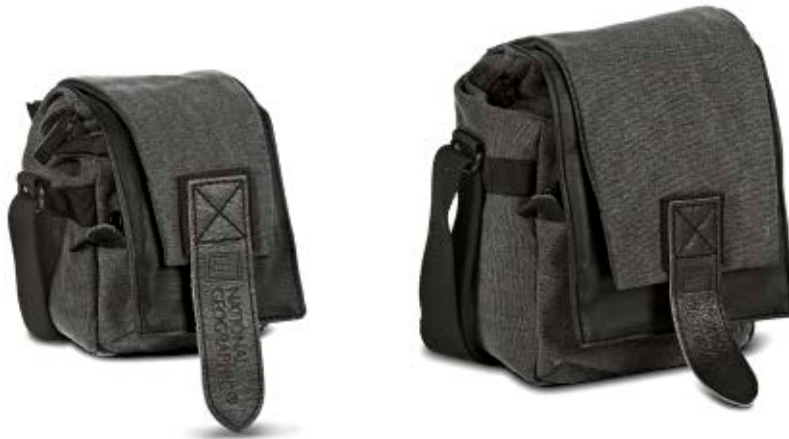
SMALL HOLSTER NG W2022

Die Walkabout Halfter (NG W2022 und NG W2026) bieten sicheren Schutz für Ihre persönlichen Dinge, Fotoausrüstung und Medienzubehör. Sie ermöglichen es Ihnen so, die wichtigsten Momente im Leben spielend festzuhalten. Mit einer modularen Trennwand kann ein zusätzliches Fach für ein Objektiv oder anderes Zubehör abgetrennt werden.