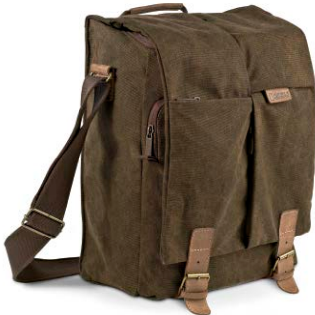
SLIM SACHEL NG A2550

Die kleine Africa Umhängetasche (NG A2550) ist eine funktionale Alltagstasche, die spezielle Schutzzonen für eine DSLR-Kamera oder einen Camcorder sowie Platz für persönliche Dinge bietet.