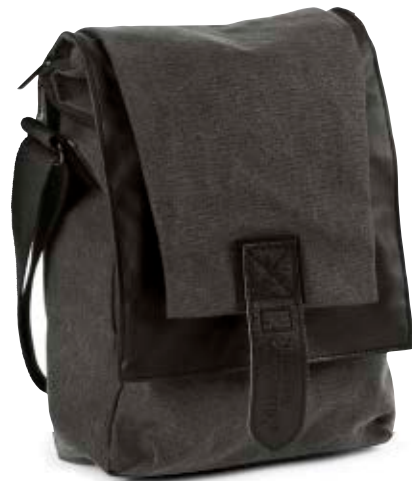
SLIM SHOULDER BAG NG W2300

Die schmale Walkabout Schultertasche (NG W2300) begleitet Sie bei Ihren alltäglichen Abenteuern und bietet sicheren Schutz für eine spiegellose Kamera mit angesetztem Objektiv, ein zusätzliches kleines Objektiv, Medienzubehör und tablet. Eine modulare Trennwand ermöglicht die individuelle Gestaltung des Innenraums.