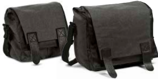
MIDI SATCHEL NG W2141