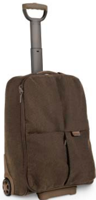
ONBOARD ROLLER NG A6010

In die Africa Reisetaschen (NG A6010 und NG A6120) passt alles, was man unterwegs benötigt. Beide Modelle verfügen über eine spezielle gepolsterte Tasche zum sicheren Transport Ihres Laptops. DSLR-Kamera und Medienzubehör finden in einem entnehmbaren, ebenfalls gepolsterten Einsatz Platz. Kleidung und Reiseutensilien lassen sich im großen Hauptfach verstaut.