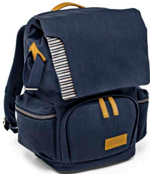
SMALL BACKPACK NG MC5320

Der kleine Mediterranean Rucksack (NG MC 5320) bietet viel Platz für Ihre persönlichen Dinge. Der obere und der untere Bereich des Rucksacks sind durch eine entnehmbare Tasche voneinander abgetrennt. Die Fotoausrüstung wird im unteren Fach sicher verstaut und kann über die Fronttasche leicht entnommen werden. Der Rucksack bietet darüber hinaus eine einfache Lösung zur Befestigung eines Stativs und Platz für einen Laptop.