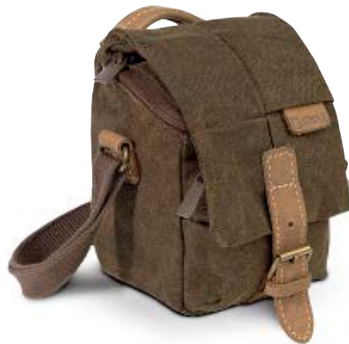
SMALL HOLSTER NG A2200

Die Africa Halfter (NG A2200 und NG A2210) bieten verlässlichen Schutz für eine kompakte Systemkamera oder eine DSLR-Kamera und Medienzubehör. Für bequemes Tragen verfügen die Taschen über einen breiten Tragegurt und einen Handtragegriff.