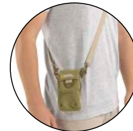
MEDIUM POUCH NG 1153

Internal Dimensions / Dimensioni Interne / Abmessungen innen: L: 9,00 cm - 3.54" / W: 6,00 cm - 2.36" / H: 12,00 cm - 4.72" External Dimensions / Dimensioni Esterne / Abmessungen Außen: L: 10,00 cm - 3.94" / W: 8,00 cm - 3.15" / H: 13,00 cm - 5.12" Weight / Peso / Gewicht: 0,22 kg - 0.49 lbs