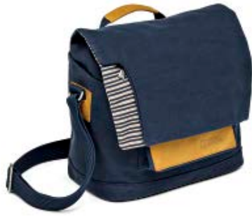
SHOULDER BAG NG MC2350