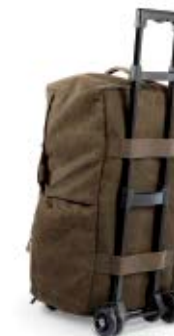
MEDIUM DUFFLE BAG NG A6120

Internal Dimensions / Dimensioni Interne / Abmessungen innen: L: 59,00 cm - 23.23" / W: 37,00 cm - 14.57" / H: 28,50 cm - 11.22" External Dimensions / Dimensioni Esterne / Abmessungen Außen: L: 60,00 cm - 23.62" / W: 38,00 cm - 14.96" / H: 29,50 cm - 11.62" Weight / Peso / Gewicht: 1,46 kg - 3.22 lbs