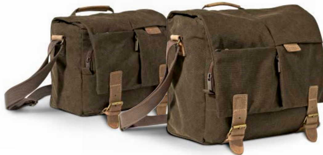
MIDI SACHEL NG A2540

Die Africa Umhängetaschen (NG A2540 und NG A2560) sind funktionale Alltagstaschen, die spezielle Schutzzonen für eine DSLR-Kamera und Platz für persönliche Dinge bieten. Für bequemes Tragen verfügen die Taschen über einen Handtragegriff, einen breiten Schultertragegurt und eine Lasche an der Rückseite zur Befestigung an einem Trolley.