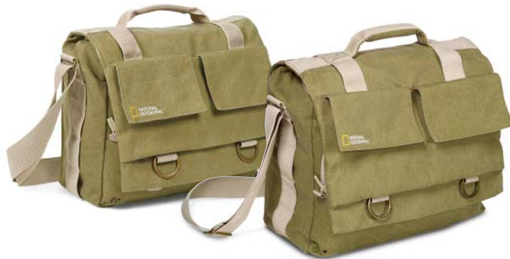
MEDIUM MESSENGER NG 2476

Die mittlere Earth Explorer Messenger-Tasche und die große Schultertasche (NG 2476 und NG 2478) sind funktionale Alltagsaschen, die ausreichend Platz für persönliche Dinge, einen Laptop und die Kameraausrüstung bieten.