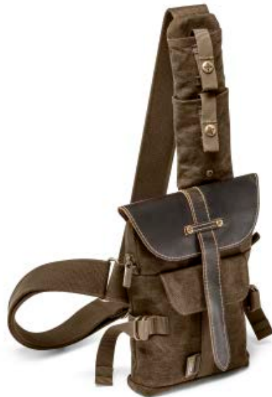
SMALL SLING BAG NG A4567

Die neuen Africa Slingtaschen (NG A4567 und NG A4569) bieten sicheren Schutz für eine Kompaktkamera oder eine kompakte Systemkamera und weiteres Zubehör. Sie sind mit hochwertigen Details aus echtem Leder ansprechend gestaltet.