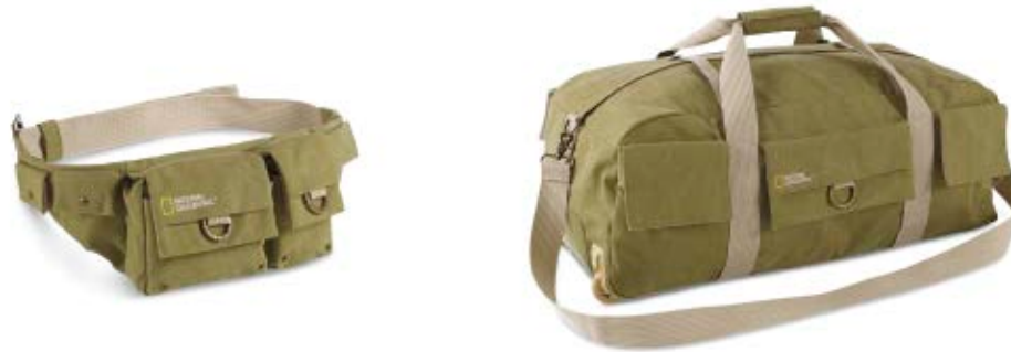
SMALL WAIST PACK NG 4476